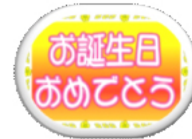
スタッフ一同、心を込めて♡