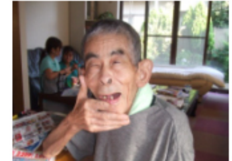
桜や馬が大好きな(=^・^=) 桂川様です。