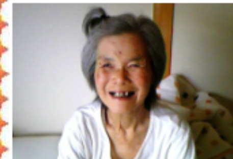
歌が大好きな(*^_^*)♪ 金川様です。